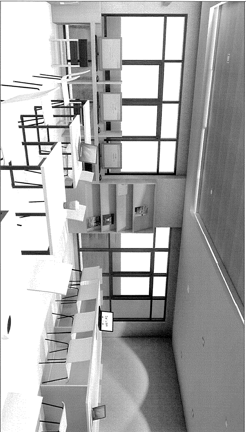
ภาพประกอบ 3 มิติ มาตรฐาน