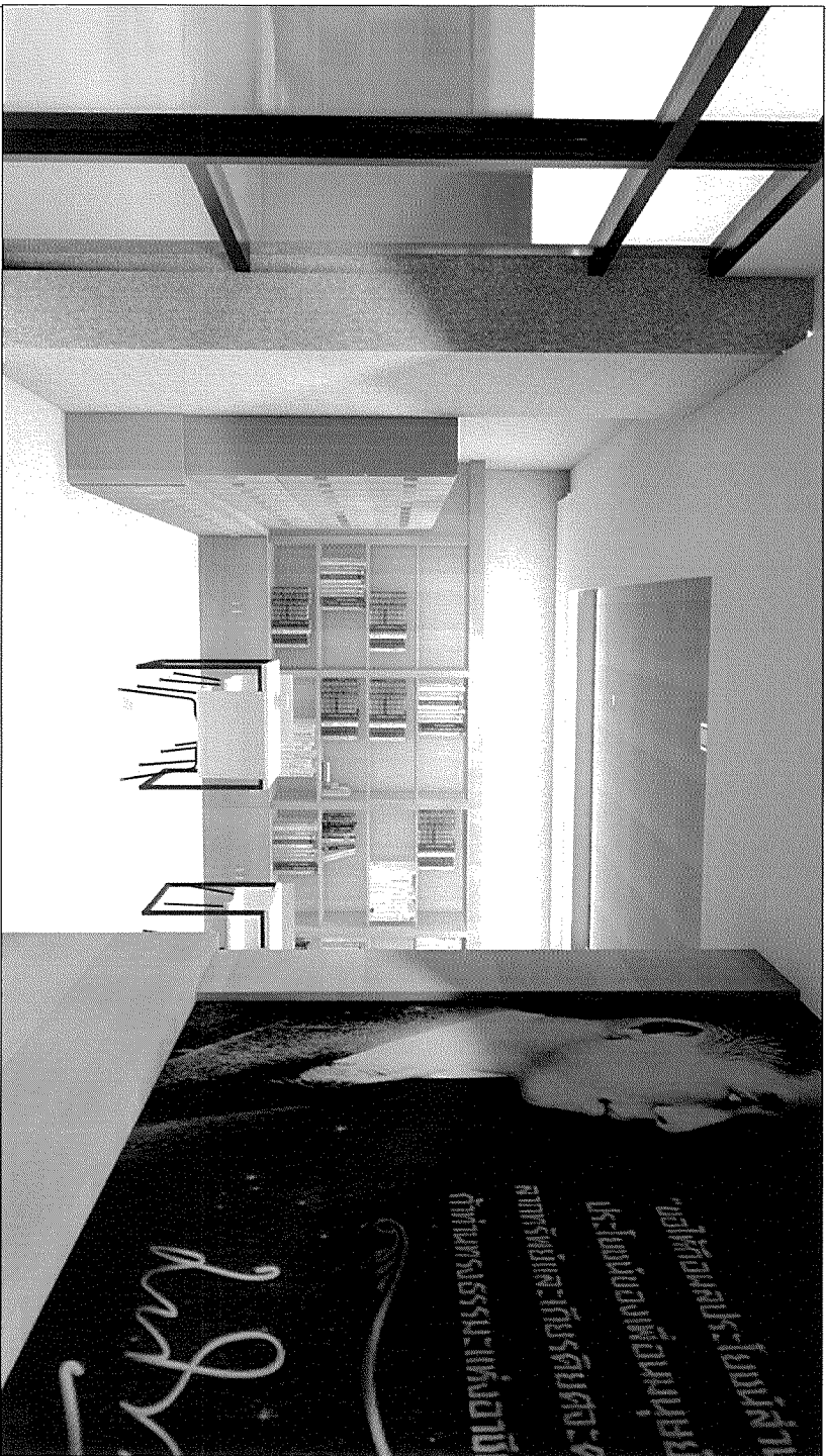
ภาพประกอบ 3 มิติ ขนาดกระดาษ